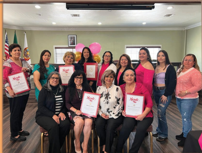
Día Internacional de la Mujer