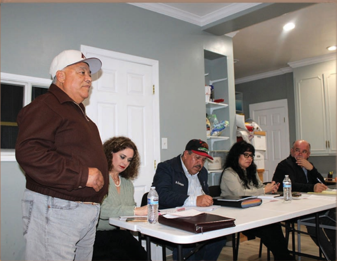
Reunión general ordinaria